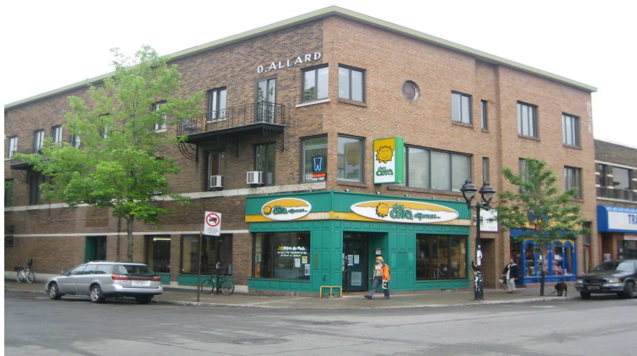
L'ancien édifice du Studios de photo Allard, avenue Mont-Royal Est, angle Garnier.

Le Studio de photographie Allard, qui a opéré dans différents locaux de l'avenue Mont-Royal à Montréal, est reconnu comme une institution majeure dans l'histoire de la photographie à Montréal, autant pour la quantité, la qualité ou la diversité de ses photographies urbaines, aujourd'hui conservées aux Archives nationales du Québec à Montréal. Une description complète du Fonds se retrouve sur le site des Archives Nationales à :